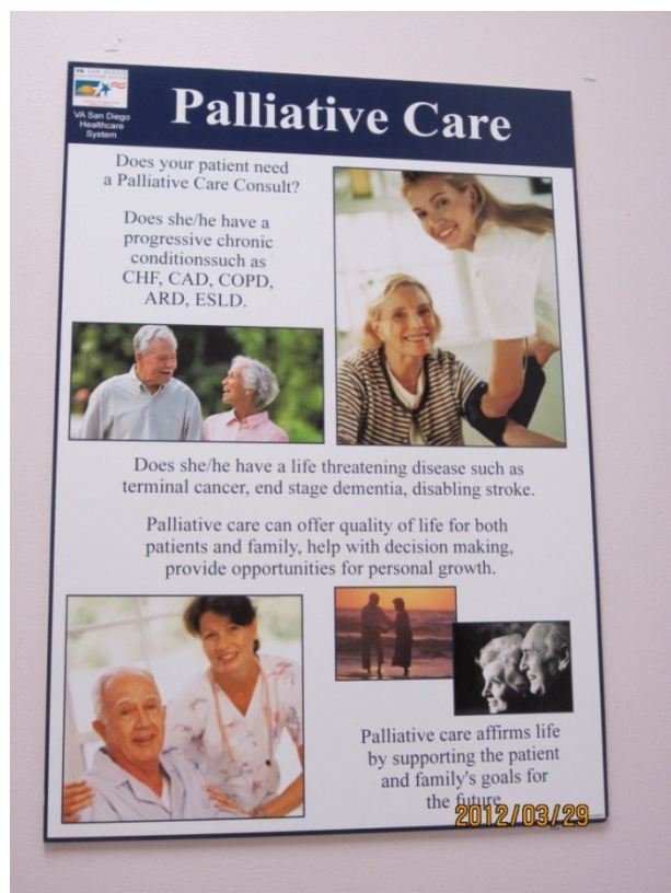
↑ Palliative care unit 病房牆上的衛教資訊

加入 hospice 系統之後，會有社工、看護、宗教人士和 hospice nurse 定期到家中訪視，當病情急性惡化無法控制時會送往 hospice care unit，做急性醫療處置，當病情穩定之後再轉往家中繼續照護。另外在榮民醫院系統還有 palliative care unit，提供榮民臨終的照護，主要的差別在於榮民可以選擇在 palliative care unit 安然的往生或得到疼痛控制，不需一定要有急性的醫療問題才能住進來。palliative care 像是一把大雨傘包含了 hospice care，進入 palliative care 的人不一定要是臨終病患，可以是各種 stage 的病人，甚至是慢性病的病人。在美國因為醫療昂貴，像在 UCSD 的附屬醫院就沒有 palliative care unit，他們只有處理急性問題的 hospice care unit，關於 palliative care 的部分傾向於門診處理，以降低醫療支出。