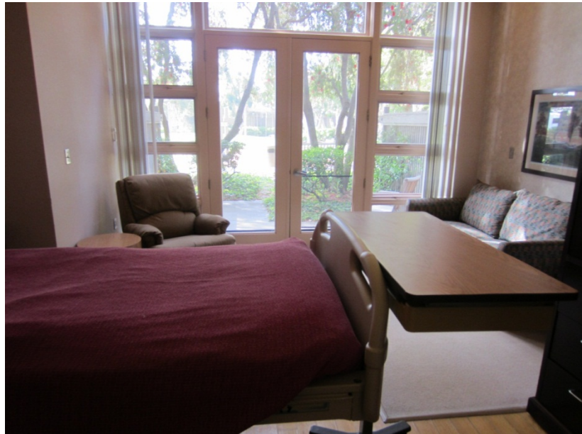
↑寬敞的病房，設計上讓病人很容易走出去接觸大自然。沒有訪客時間，所以也擺設了很多沙發床工家屬或朋友過夜。

的組織架構裡念和整個醫院環境(hospice care unit)的設計理念。他們用了很多自然的素材在建構整個病房，以寬敞的空間減少壓迫感，並且設計讓每個房間都能輕易接觸到庭院。沒有訪客時間的限制，定期舉辦藝文活動邀約家屬和朋友來病房，他們的理念是希望能為病人帶來陪伴和人群，並試著讓人群更了解安寧照護。除了 inpatient service 外，他們也有做研發，尤其是疼痛控方面的研究；並且有提供很多 international fellowship program，也許之後有機會我會有去嘗試看看。