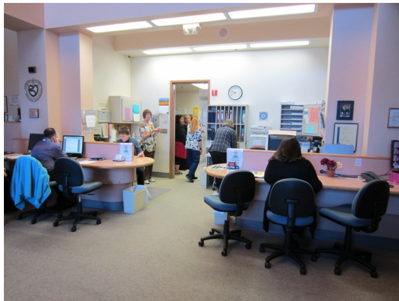
↑半開放式的護理站，給病患較多親近感

總歸來說，在老人醫學實習的這一個月，收獲非常豐碩。要感謝 UCSD 方面給了我這麼豐富多元的實習機會和場所；也給予我很大的自由度，讓我對有興趣的部分可以再多安排參訪或是學習課程供我瞭解。若學弟妹對於美國的家庭醫學