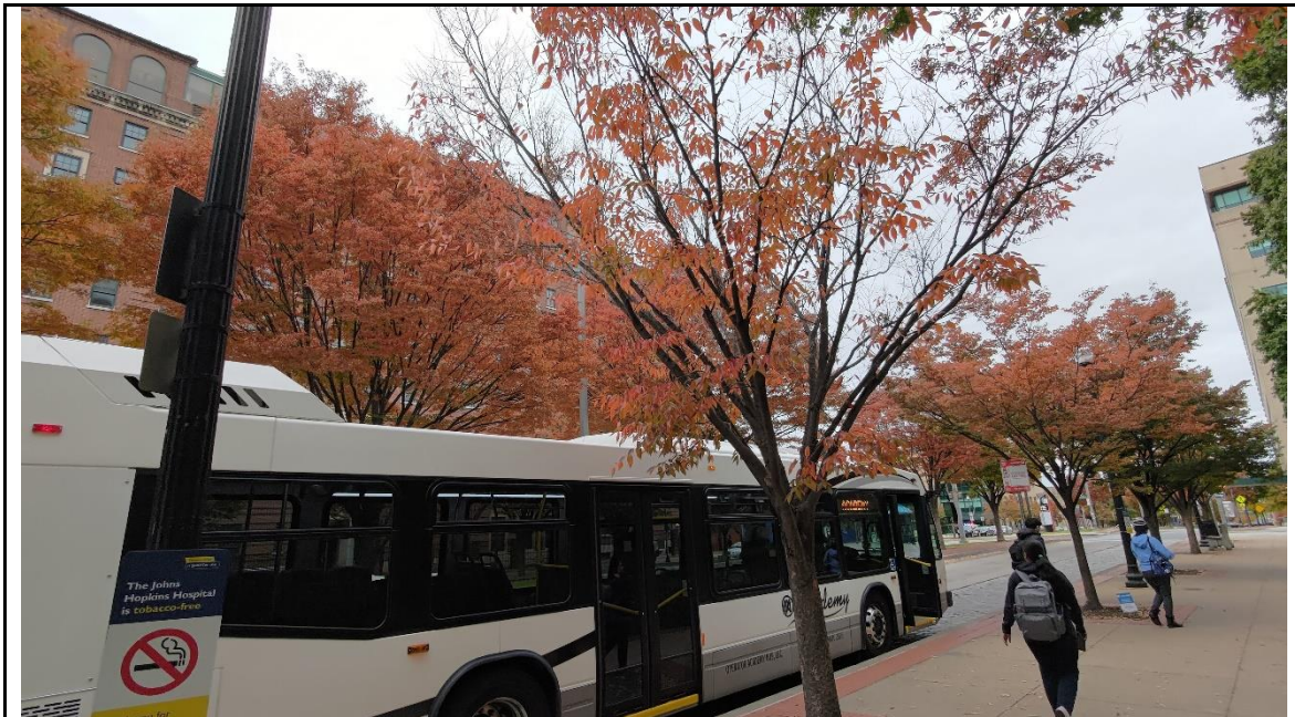
穿梭在城市與校區之間的接駁車，停靠在總院區大道上

看到在西岸聖地牙哥(San Diego)實習的同學發布的動態，也可以感受到不同城市、不同醫院的文化差異，西岸同學地實習部門常常會相約在中午或下班後去吃飯、吃冰，周五還會各自帶點食物一起分享。但在我的實習單位，大家通常只專注於工作，沒有這些休閒活動，甚至不太會聊私事。我們可以從城區古典優美的建築中揣摩這座城市輝煌的歷史，但在醫院中見著常民生活的模樣，我漸漸能體會到偉大城市背後的無奈。約翰霍普金斯大學的醫學院與公共衛生學院名滿天下，但他們豐富的經驗很大一部份奠基於這座城市許多複雜的公共衛生問題。市公車頂的廣告敦促我進行免費性病篩檢、地鐵牆上提醒我新冠肺炎是真實存在的疾病、火車站內則宣傳愛滋病暴露前預防性投藥(pre-exposure prophylaxis, PrEP)的重要性、當地醫學院同學向我提到，美國鴉片類止痛藥氾濫的問題已經演變為一條從藥廠至黑市的產業鏈。在醫院亮晃晃的日光燈之外，有許多角落仍因經濟困難、教育不平等、健康資源有限而不見天日。