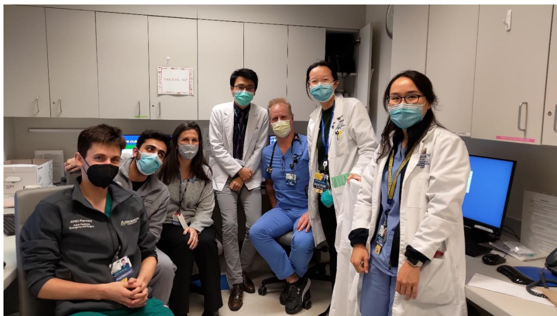
實習最後一日下午，在病房與團隊成員合影留念