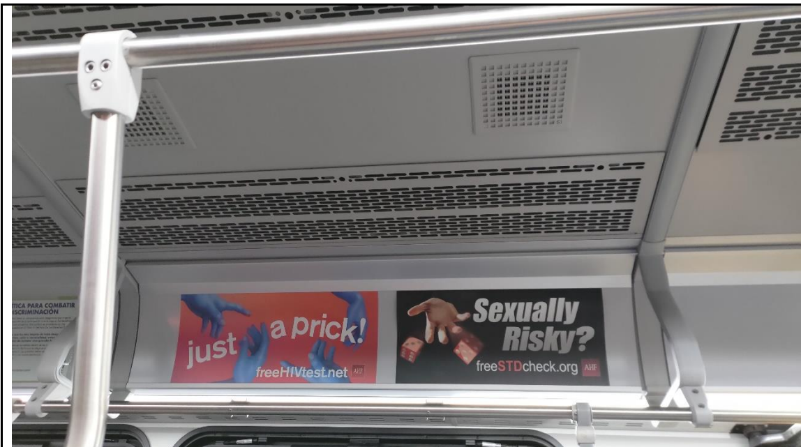
公車上的性病檢測廣告，反映出當地的公共衛生問題