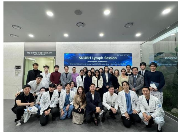
上左圖：很榮幸能參加 PRS；上右圖：PRS 隔天的 Lymph Symposium